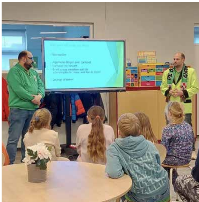
unit 2 basisschool Het Kompas Heijningen