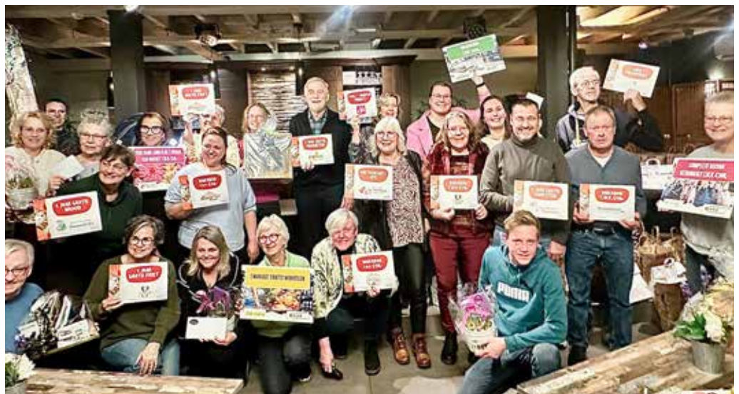
25 prijswinnaars

In de zaal staat een muur van gele kistjes op een tafel. Op elk kistje is een ster met een nummer van 1 tot en met 25 aangebracht. De kistjes staan in willekeurige volgorde. Het geheel