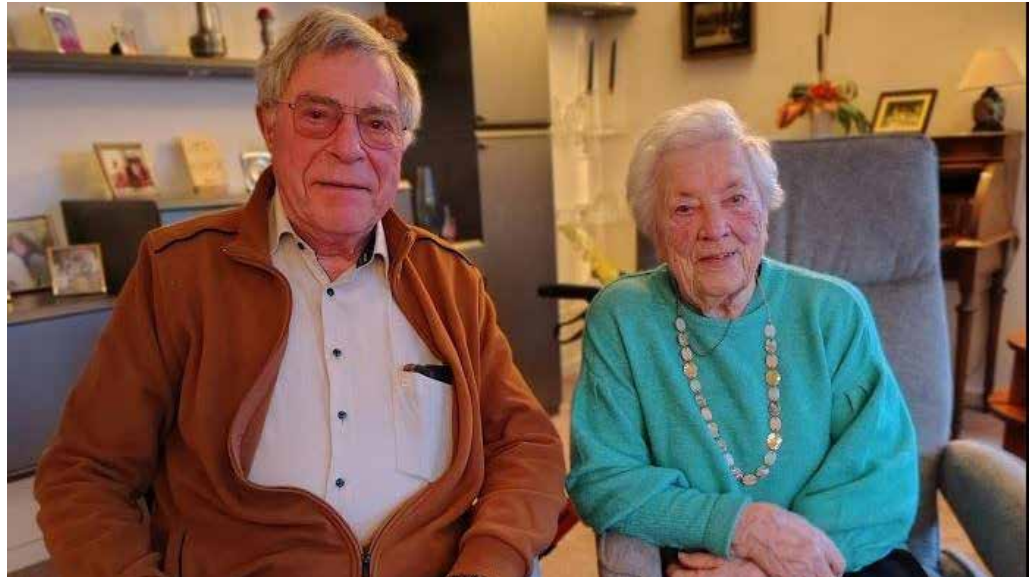
De directie van de ZNS