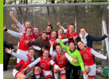
Een stralende lach