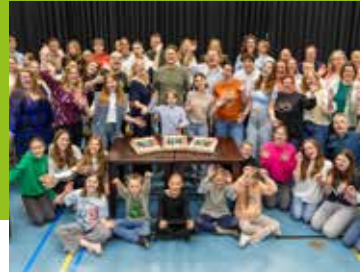
Kaartverkoop Oliver! gestart