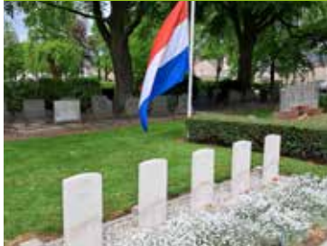
Terugblik 4, 5 en 6 mei