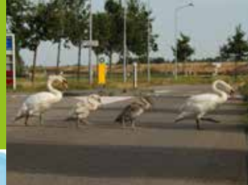
De Knobbelzwaan Pagina 10