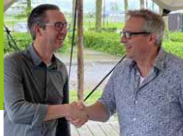
Feestweek in nieuw jasje Pagina 6