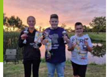
't Schietertje Pagina 13