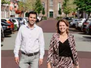
Brouwerij de Toekomst Pagina 3