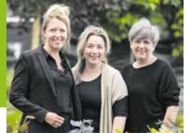
Uitbreiding team Omzien Pagina 9