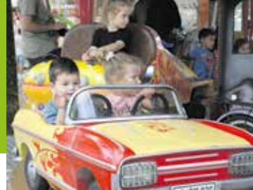
Terugblik Fendertse Week Pagina 7