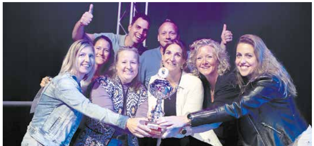
Het team Kwis um nam voor de eerste keer deel aan de Fendert Kwis en ging meteen met de overwinning aan de haal.

de teams acht weetvraagrondes, vier doevragen, twee rode draden en een superronde voorgeschoteld. In de weetvraagrondes werd de kennis getest over onder andere icoontjes op het dashboard van de auto, gitaarsolo's, artiestennamen, memorabele sportmomenten en koolsoorten. Uiteraard werd ook gevraagd naar gebeurtenissen en situaties in Fijnaart en Heijningen en de gemeente Moerdijk. Bij de doevragen moesten de deelnemers dit keer echt de handen uit de mouwen steken. Zo kregen zij kleurplaten van 12 Europese vlaggen, die zij met de juiste kleuren moesten inkleuren. Verder werd de kennis getest over straten uit het Monopolyspel, attractieparken en