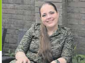
Myxx Fotografie Pagina 6