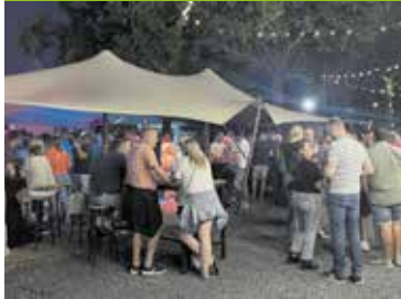
Terugblik Fendertse Week Pagina 5