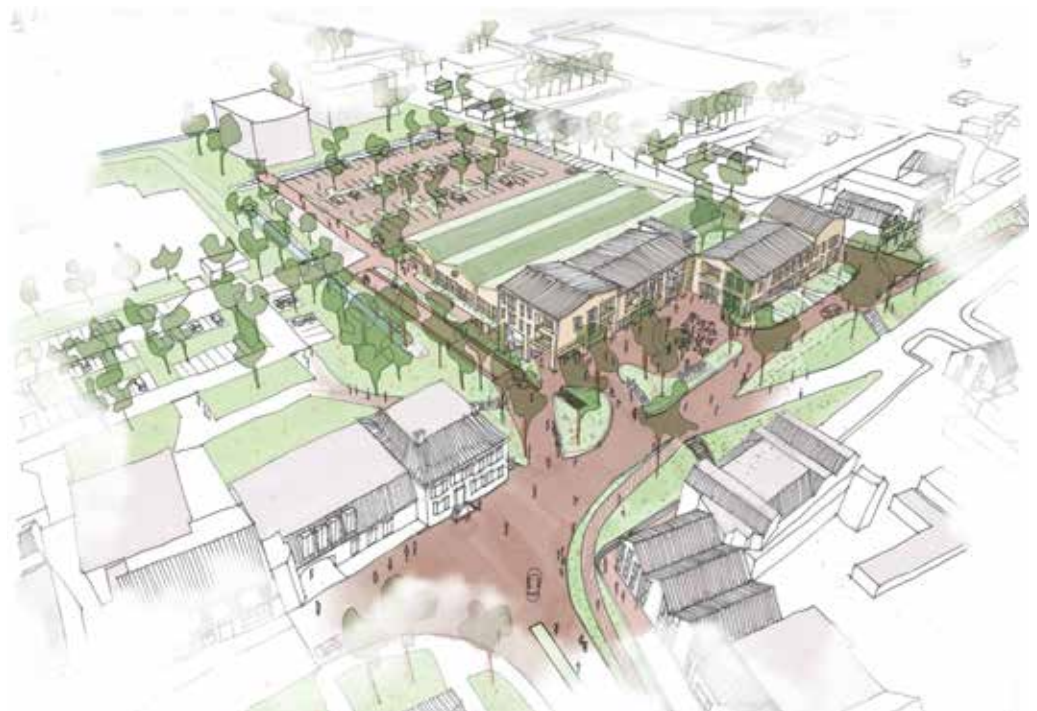
Voorlopige schets centrumontwikkeling.

Al lange tijd geven inwoners van Fijnaart aan dat het mooie dorp nog mooier zou zijn met een bruisende kern. Vijf jaar geleden is hier gehoor aan gegeven door de Gemeente Moerdijk en is er gekeken naar de mogelijkheden. De gemeente besloot in 2020 een bedrag uit te trekken om de centra van Fijnaart, Willemstad en Klundert een impuls te geven. Al vrij snel werd in Fijnaart een klankbordgroep gevormd, bestaande uit ondernemers, omwonenden en vertegenwoordigers van de Dorpsafel. Een adviesbureau leverde al vrij snel een eerste ontwerp