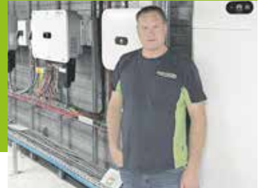
Bedrijveninterview Pagina 10