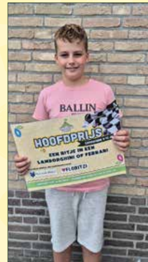
De twee jongste winnaars