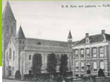
150 jaar d'Engelenburgh Pagina 7