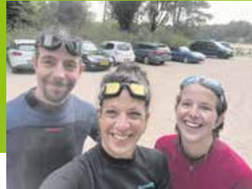
Help ons de grachten door Pagina 9