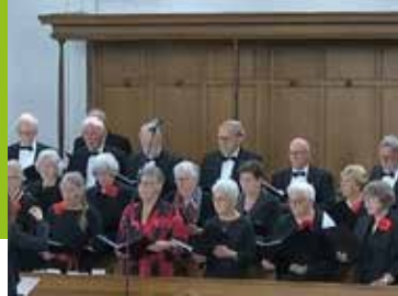
Zingen bij het Koor