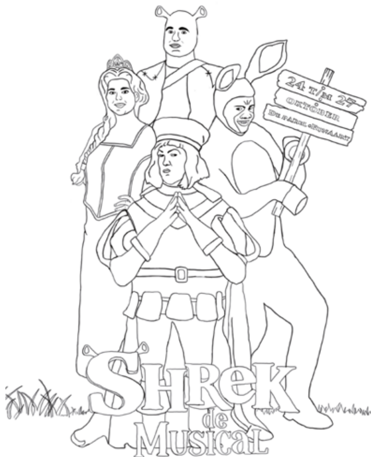
De kleurplaat die is uitgedeeld op de scholen.