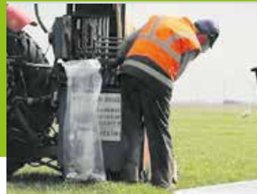
Inloopavond onderzoek aardwarmte Krukweg Pagina 7