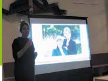
Bedrijfsbezoek Pagina 5