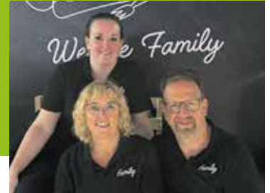
Bedrijveninterview Pagina 8