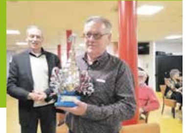
Grote beker Westhoek Drive