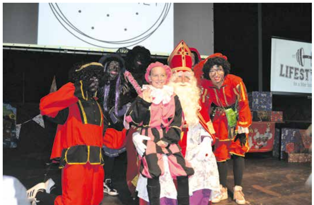
De kinderen mogen uiteraard op de foto met Sinterklaas.

Speciaal voor Sinterklaas wordt de sporthal van De Parel omgebouwd tot een gezellige welkomsthal met muziek en een leuk programma. Dit jaar is een Pietenparcours uitgezet voor de kinderen.