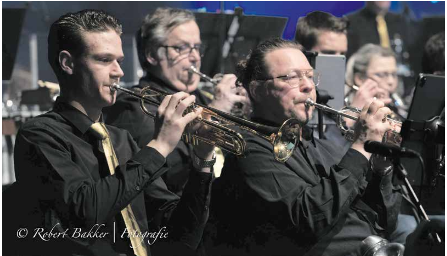
Maak het mee om te spelen in een musicalorkest voor volle zalen. Meld je aan!

Bespeel je een blaasinstrument of heb je dat in het verleden gedaan? En lijkt het je leuk om in een musicalorkest te spelen? Dan is dit je kans! In het laatste weekend van de herfstvakantie brengen Muziekvereniging Oranjevaan en Stichting Cultuur Fijnaart (SCF) de tijdloze musical Oliver! . De muziek wordt gespeeld door een 50-koppig orkest, waar jij deel van uit kunt maken. Meld je aan via het aanmeldformulier op www.oranjevaan.nl