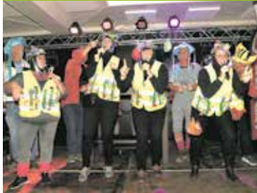
Ellufdu van dun Ellufdu