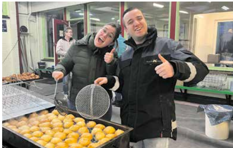
De oliebollen van Oranjevaan zijn altijd topkwaliteit!

Door oliebollen te kopen zorg je niet alleen voor een heerlijk smulmoment, maar steun je ook de producties van Oranjevaan. Na Ciske de Rat, Oorlogswinter en The best of... MUSICALS is Shrek de Musical de volgende productie die Oranjevaan en Stichting Cultuur Fijnaart samen ten tonele voeren. Dit keer is gekozen voor een familiemusical waar jong en oud veel plezier aan beleven. De voorstelling zit boordevol grappen en grollen, maar ook