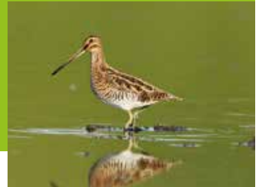
Het hoekje van de natuurliefhebber