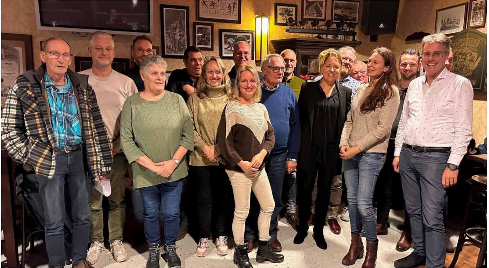
Leden klankbordgroep Centrumplan Fijnaart

Droomt u ook over een levendig centrum in Fijnaart? Wij als klankbordgroepleden wel! We zijn uiteraard realistisch. Fijnaart is een klein plattelandsdorp. Maar we mogen wel dromen over het behouden en verstevigen van voorzieningen die er nu zijn. Een centrum waar het fijn is om door heen te lopen, waar we elkaar kunnen ontmoeten, waar we winkels kunnen bezoeken en waar we met elkaar een lokaal evenement organiseren. Om ons centrum vitaal te houden, ook voor de volgende generaties, is het goed om daar nu over na te denken en op in te spelen.