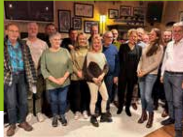
Vitaal Centrum Fijnaart