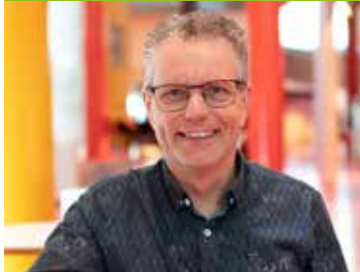
Lokaalredacteur begint musicalmagazine