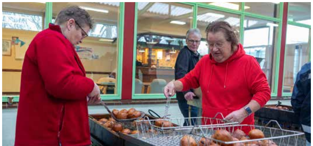
De oliebollen worden gebakken in professionele bakstellen.

Tegenwoordig worden de oliebollen niet langer gebakken in kleine pannetjes, maar in professionele bakstellen. Het 'inscheppen' gebeurt met een plopmachine. Het bakken gebeurt ook niet langer in een keuken bij iemand thuis, maar in 't Onderdak. Het beslag wordt