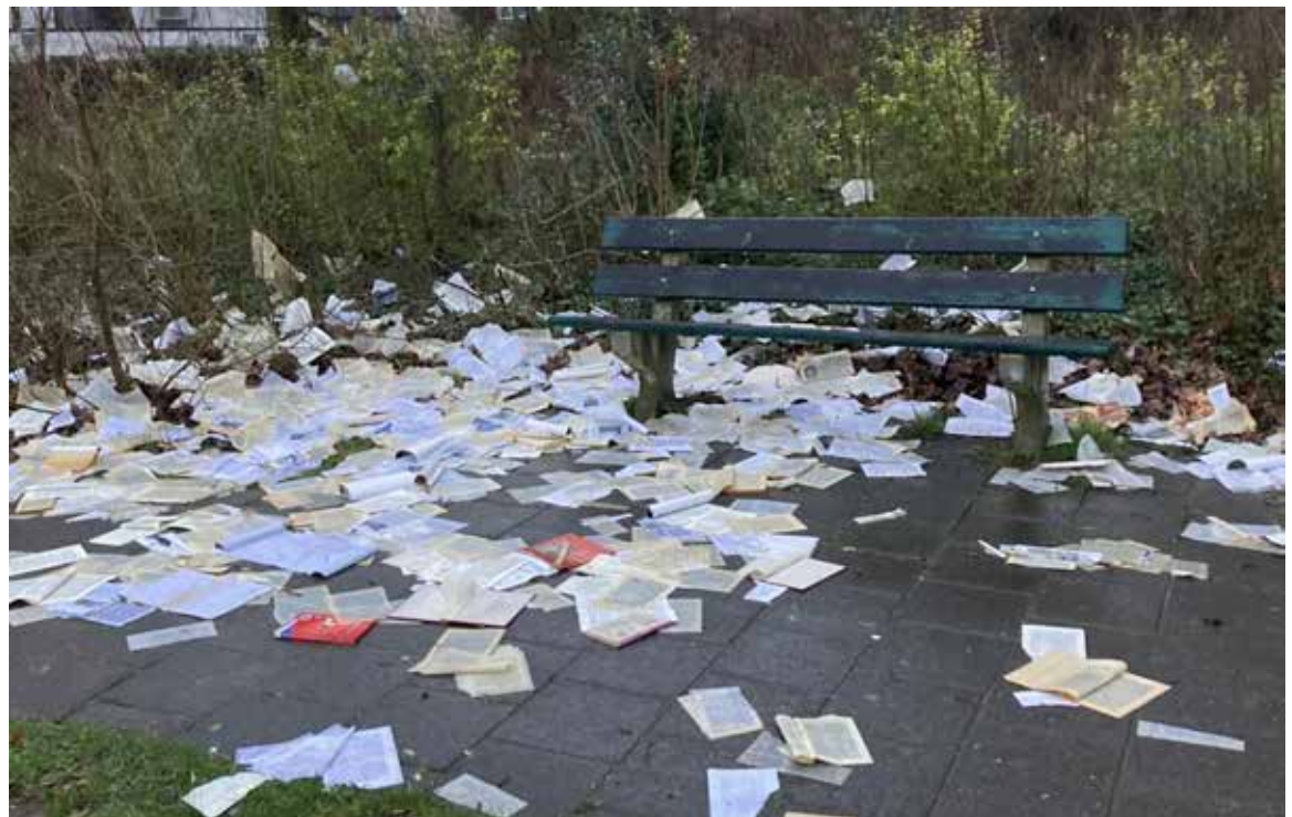
De verscheurde boeken uit de minibieb

Zondagavond 25 februari hebben onbekenden de minibieb aan Langs de kreek leeggehaald en alle boeken vernield.