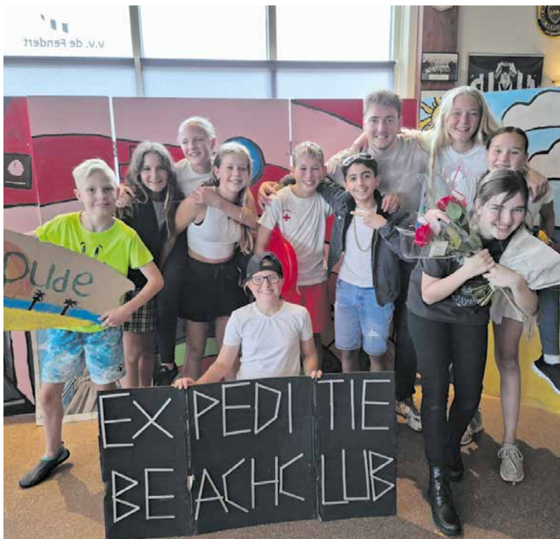
Groep 8 2023

Dat ons mooie dorp uitpuilt van muzikaal en creatief talent is alom bekend. De kinderen van groep 8 van OBS De Springplank zetten deze rijke Fijnaartse traditie voort door een prachtige eindmusical op te voeren. Afgelopen woensdag was het zover. Na vele oefensessies presenteerden de kinderen de musical 'Expeditie Beachclub'.