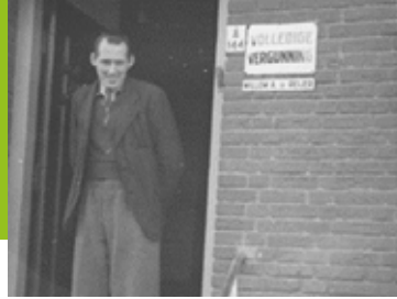
Keep Memories Alive