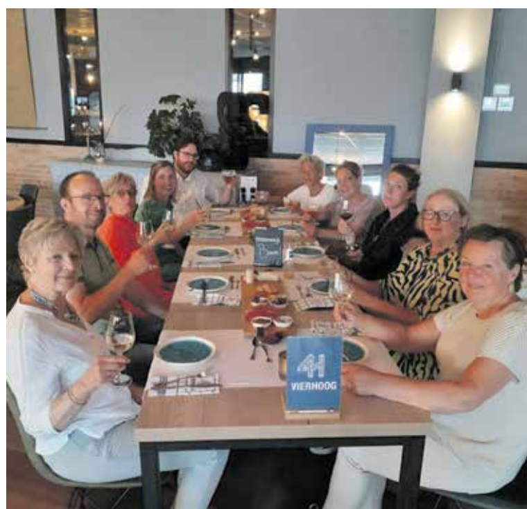
Klup '83 40 jaar

Omdat de kinderen dit jaar allemaal al 40 zijn geworden, gingen we met z'n tien eerst bowlen en daarna was er alle tijd om lekker te eten en gezellig bij te praten. (zie foto) Tijdens die 40 jaar kregen onze kinderen zelf ook weer kinderen, in totaal 17! Wij moeders zijn dus allemaal al grootmoeder en hebben samen maar liefst 44 kleinkinderen! Na al die jaren is het nog steeds fijn om regelmatig samen te komen en dan ons leven van alle dag te relativeren en een klein beetje extra te vieren. Wij hopen dit nog heel lang met ons vijven en in jubileumjaren samen met Jessy, Femke, Ursela, Peter en Bas te mogen doen!