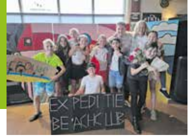
Groep 8 De Springplank in 'Expeditie Beachclub!'