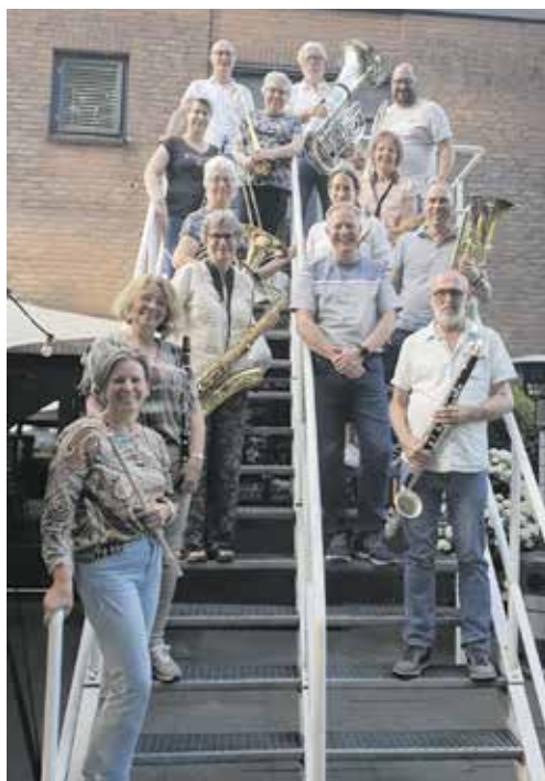
Muziekvereniging de Unie

Muziekvereniging De Unie, inmiddels meer dan 150 jaar oud, maakt nog steeds met veel plezier muziek. Er wordt elke donderdagavond in De Graanbeurs gerepeteerd onder de deskundige en enthousiaste leiding van Edwin Matthee.