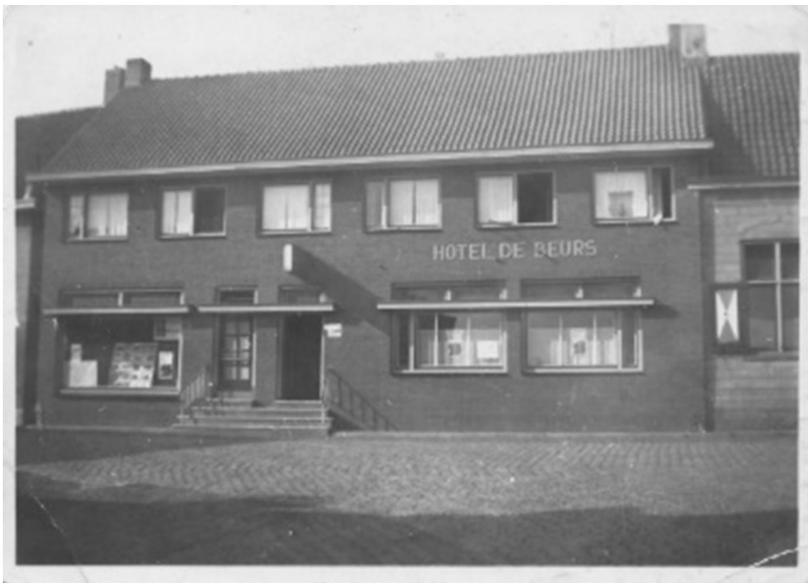
Hotel de Beurs