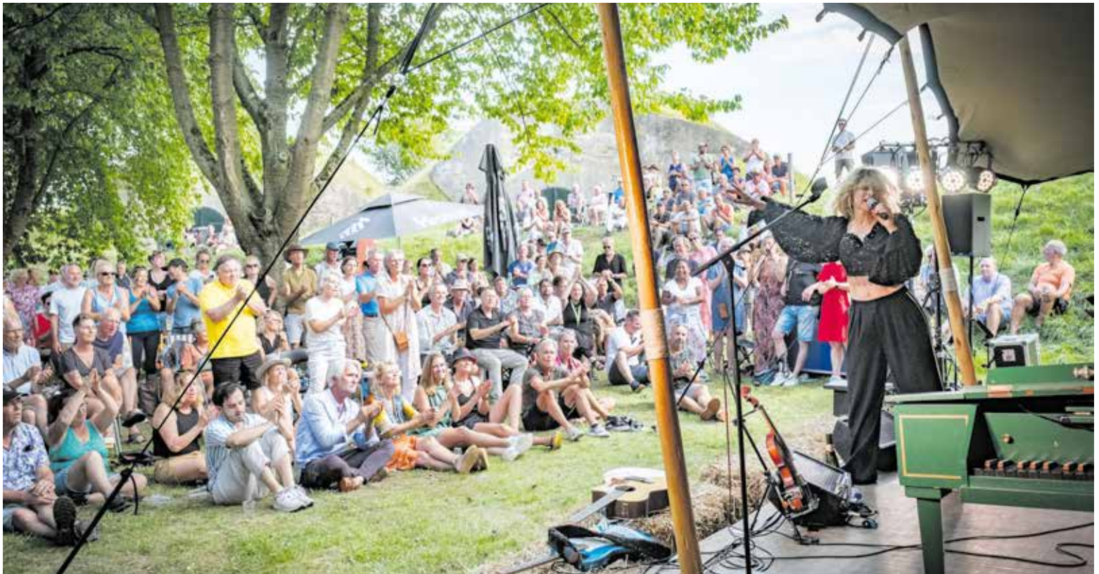
Optreden Ellen ten Damme op Fort Sabina