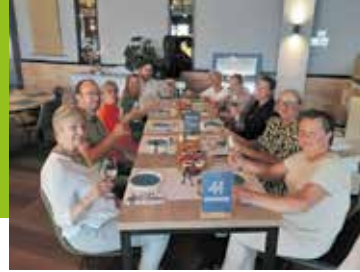
1983 – 2023 Zwangerschapsgym Klup '83